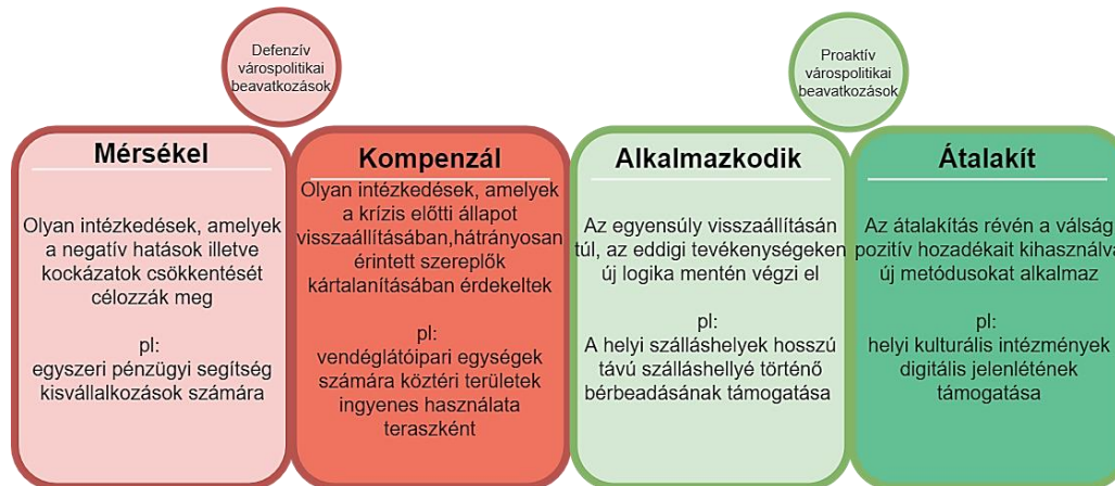
3. ábra: Válságkezelő intézkedések csoportosítása.

A válság lefutását illetően mindvégig kérdés (volt?), hogy az miképpen írható le: gyors visszapattanással folytathatjuk-e korábbi életünket („V” alakú válsággörbének megfelelően, azonban ezt gyakorlatilag jelen esetben elvethetjük) esetleg lassú kilábalásnak és elhúzódó recesszióknak nézünk elébe (L alakú válsággörbe), vagy többszöri visszaesések és konjunkturális periódusok követik egymást (W alakú válságlefutás). Ha a válságkezelő intézkedéseket -a városok példáján- csoportosítani kívánjuk, annak növekvő mértékű befolyása („radikalitása”) alapján, akkor megkülönböztethetünk „defenzív”, illetve „proaktív” várospolitikai beavatkozásokat (3. ábra).