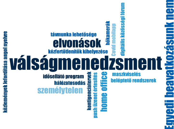
1. ábra: Az interjúk leggyakrabban előkerülő témáiból képzett ún. kódfelhő-diagram. Forrás: saját szerkesztés.